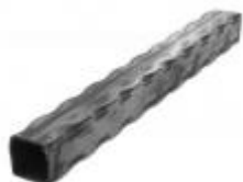
арт.40402T 3000x40x40 вес 7,2 кг.