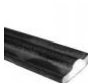
арт.1506 2000x14x4 вес 0,7 кг.