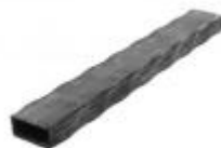
арт.40202T 3000x40x20 вес 3,9 кг.