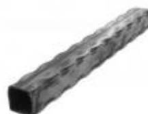
арт.20202T 3000x20x20 вес 2,7 кг.