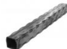
арт.30302T 3000x30x30 вес 4,0 кг.