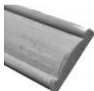
арт.1508 2000x20x4 вес 0,93 кг.