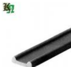
арт.1505 2000x14x4 вес 0,7 кг.