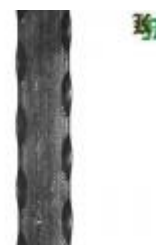
арт.25401П 3100x25x4 вес 2,4 кг.