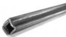
арт.15015T 3000x15x15 вес 2,1 кг.