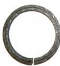
арт.19000-150.14 L=150 кв.14 вес 0,45 кг. Цена: 70 руб.