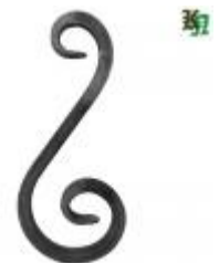
арт.19408.5 220x90, кв.12x12 вес 0,520 кг Цена: 85 руб.