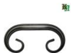
арт.15423 160x75, труба 15x15 вес 0,170 кг Цена: 25 руб.