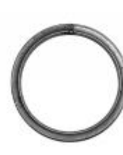
арт.15411 д=149мм, труба 15x15 вес 0,200кг Цена: 39 руб.