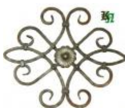
арт.173 430x515, кв. 12x12 вес 4,600 кг. Цена: 950 руб.