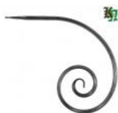
арт.15500 500x420, труба 15x15 вес 0,720 кг Цена: 80 руб.