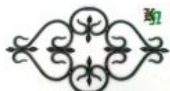
арт.176 750x400, кв. 10x10 вес 4 кг Цена: 740 руб.