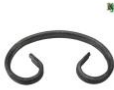
арт.19040.5 135x75, полоса 6x12 вес 0,180 кг Цена: *** руб.