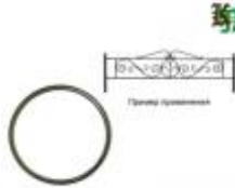
арт.15415 D = 350мм., труба15х15 вес 0,460 Цена: 76 руб.