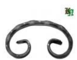
арт.19073.1 105х65, полоса 6х12, вес 0,140 кг Цена: 32 руб.