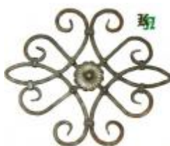
арт.173 430x515, кв. 12x12 вес 4,600 кг. Цена: 950 руб.