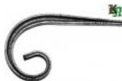
арт.15000 123x70, труба 15x15 вес 0,120 кг. Цена: 17 руб.