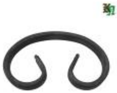
арт.19073.5 110x67, полоса 6x12, вес 0,130 кг Цена: 30 руб.