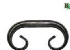
арт.15422 140x72, труба 15x15 вес 0,170 кг Цена: 22 руб.