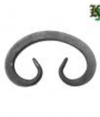
арт.19400.5 125x80, кв.12x12 вес 0,300 кг Цена: 50 руб.