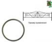
арт.15415 D = 350мм., труба15x15 вес 0,460 Цена: 70 руб.