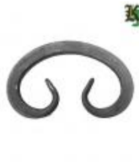
арт.19400.5 125х80, кв.12х12 вес 0,300 кг Цена: *** руб.