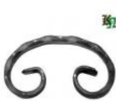
арт.19040.2 130х75, полоса 6х12 вес 0,185 кг Цена: *** руб.