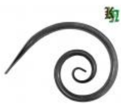
арт.15300 210x215, труба 15x15 вес 0,370 кг Цена: 38 руб.