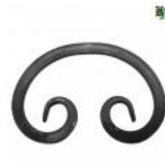
арт.19403.5 220x130, кв.12x12 вес 0,500 кг Цена: 90 руб.