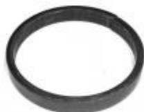
арт.19010 д=100мм, полоса 6x12 вес 0,150 кг. Цена: 31 руб.