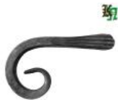
арт.19001.5 140x75, кв. 12x12 вес 0,250 кг Цена: 43 руб.