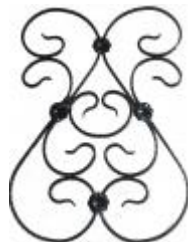
арт.177 850x570, кв. 10x10 вес 5 кг Цена: 920 руб.