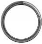
арт.15412 д=200мм, труба 15х15 вес 0,226 кг Цена: 60 руб.