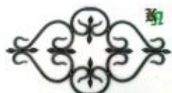
арт.176 750x400, кв. 10x10 вес 4 кг Цена: *** руб.