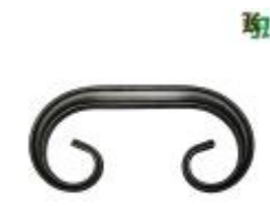
арт.15423 160x75, труба 15x15 вес 0,170 кг Цена: 25 руб.