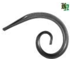
арт.15200 210x129, труба 15x15 вес 0,270 кг Цена: 32 руб.