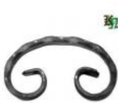
арт.19040.2 130x75, полоса 6x12 вес 0,185 кг Цена: 38 руб.