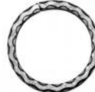
арт.19000-13 Д=130мм., кв.12x12 вес 0,380 кг. Цена: 180 руб.