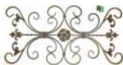
арт.172 1025x520, кв. 10x10 вес 8,100 кг. Цена: 2200 руб.