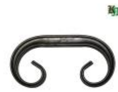
арт.15422 140x72, труба 15x15 вес 0,170 кг Цена: 22 руб.