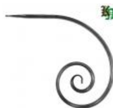
арт.15500 500x420, труба 15x15 вес 0,720 кг Цена: 80 руб.