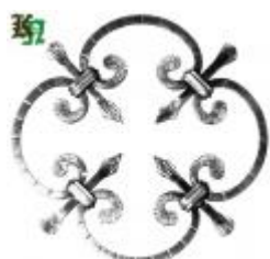
арт.171 д=250 кв. 8x8 мм. вес 0,850 кг. Цена: 180 руб.