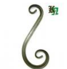
арт.15408 260x105, труба 15x15 вес 0,260 кг. Цена: 30 руб.