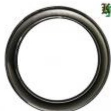
арт.15414 D=120мм., труба 15x15 вес 0,150 кг Цена: 35 руб.