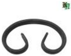
арт.19073.5 110х67, полоса 6х12, вес 0,130 кг Цена: 30 руб.