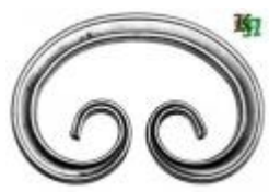
арт.15402 160x110, труба 15x15 вес 0,230 кг. Цена: 31 руб.