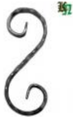
арт.19085 170x65, полоса 6x12 вес 0,210 кг. Цена: 40 руб.