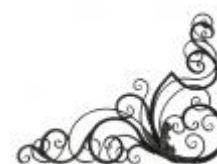
арт.812 1119x1445 профиль 20x20, 10x10 вес 8,85 Цена: 1400 руб.