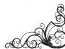
арт.812 1119x1445 профиль 20x20, 10x10 вес 8,85 Цена: *** руб.