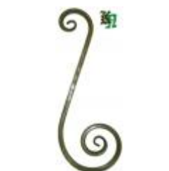
арт.15404 545x192, труба 15x15 вес 0,600 кг. Цена: 67 руб.