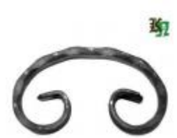
арт.19073.1 105x65, полоса 6x12, вес 0,140 кг Цена: 32 руб.