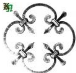
арт.171 д=250 кв. 8x8 мм. вес 0,850 кг. Цена: 180 руб.