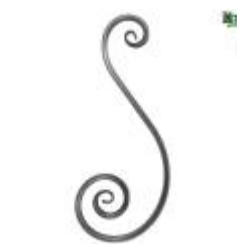
арт.15409 600x235x120, труба 15x15 вес 0,710 кг Цена: 75 руб.