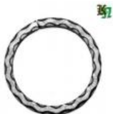
арт.19000-15 Д=150мм., кв.12x12 вес 0,450 кг. Цена: 110 руб.