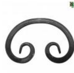
арт.19403.5 220х130, кв.12х12 вес 0,500 кг Цена: 90 руб.