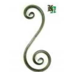
арт.15405 395x155, труба 15x15 вес 0,460 кг. Цена: 47 руб.