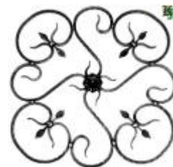
арт.175 550x550, кв. 10x10 вес 4,300 кг. Цена: 880 руб.