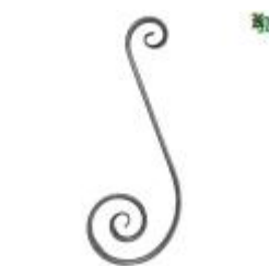
арт.15419 765x265x140, труба 15x15 вес 0,680 кг Цена: 125 руб.