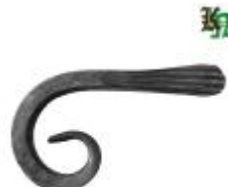
арт.19001.5 140x75, кв. 12x12 вес 0,250 кг Цена: 43 руб.