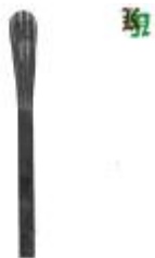
арт.19002.5 L=165мм, кв. 12x12 вес Цена: *** руб.