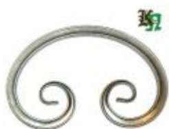
арт.15403 240x155, труба 15x15 вес 0,380 кг. Цена: 45 руб.