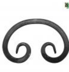
арт.19402.5 175x115, кв.12x12 вес 0,500 кг Цена: 70 руб.