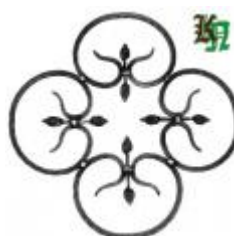
арт.174 470x470, кв. 10x10 вес 2,400 кг. Цена: 490 руб.