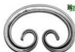
арт.15400 140x96, труба 15x15 вес 0,200 кг. Цена: *** руб.