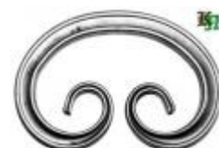
арт.15400 140x96, труба 15x15 вес 0,200 кг. Цена: 27 руб.