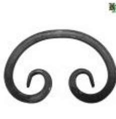
арт.19402.5 175х115, кв.12х12 вес 0,500 кг Цена: *** руб.