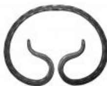
арт.177.01 210x160 кв. 10x10 Цена: 80 руб.