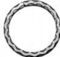
арт.19000-10 Д=100мм., кв.12x12 вес 0,300 кг. Цена: *** руб.