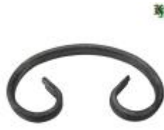
арт.19040.5 135х75, полоса 6х12 вес 0,180 кг Цена: 35 руб.