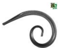
арт.15200 190x162, труба 15x15 вес 0,270 кг Цена: 32 руб.