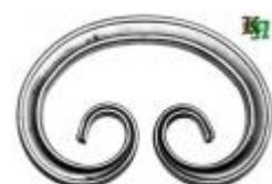
арт.15402 160x110, труба 15x15 вес 0,230 кг. Цена: *** руб.