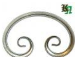
арт.15403 240x155, труба 15x15 вес 0,380 кг. Цена: *** руб.