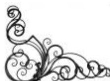
арт.811 1119x1445, профиль 20x20 и 10x10 вес 8,85 Цена: 1400 руб.