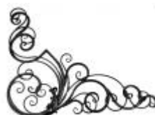
арт.811 1119x1445, профиль 20x20 и 10x10 вес 8,85 Цена: *** руб.