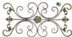
арт.172 1025x520, кв. 10x10 вес 8,100 кг. Цена: 2200 руб.