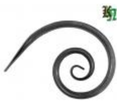
арт.15300 240x170, труба 15x15 вес 0,370 кг Цена: 38 руб.