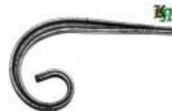
арт.15000 123x70, труба 15x15 вес 0,120 кг. Цена: 17 руб.